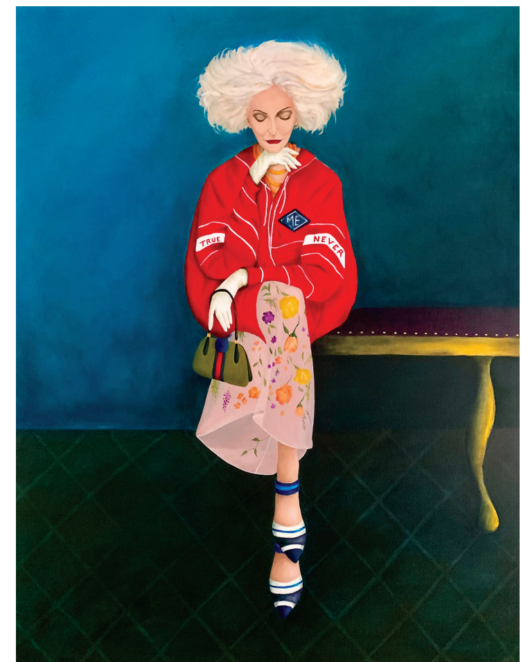
The New Age Huile sur toile 116 x 86 cm