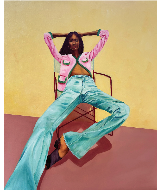
Jeans Attitude Huile sur toile. 65 x 54 cm.