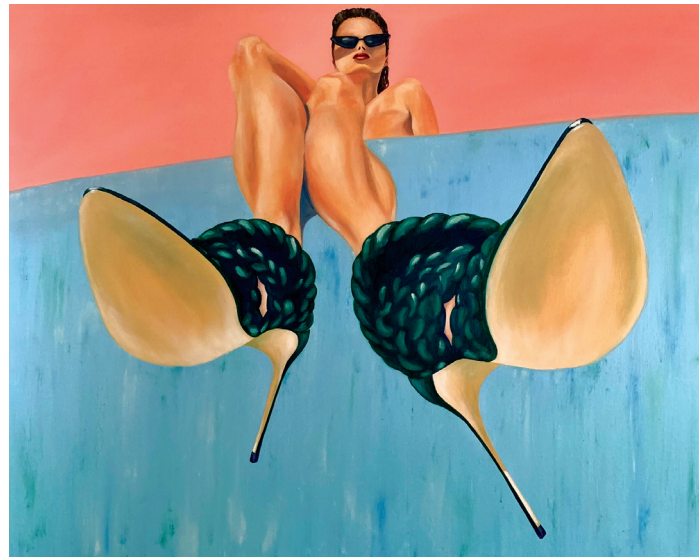
High Up Heels Huile sur toile. 80 x 100 cm