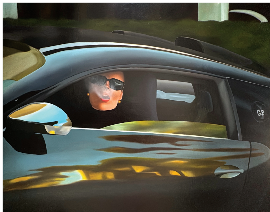
The Cigare Huile sur toile. 89 x 116 cm.