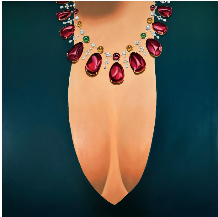
Le Collier Huile sur toile. 80 x 80 cm

Lorsque Anne-Marie Mossé peint des femmes, elle capture et met en valeur leur sensualité et leur force, comme si rien ne pouvait les empêcher d'être pleinement elles-mêmes : fières, fortes et libres.